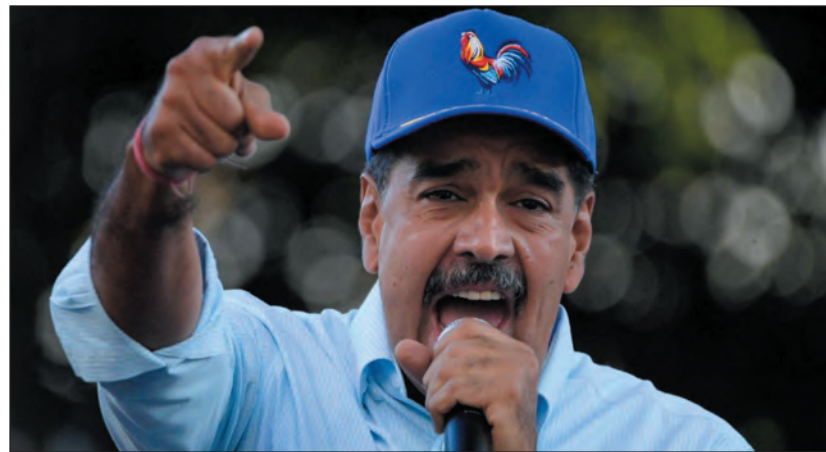
Venezuela. Maduro, aki szítja a gyűlöletet Izrael és a zsidók ellen

Maduro elődje, Hugo Chávez 1999-ben történt hatalomra kerülése óta hittestvéreink száma 22 ezerről 6000-re csökkent Venezuelában. A jelentős elvándorlást a romló gazdasági helyzet mellett elsősorban az agresszív antiszemita incidensek, valamint az Izrael-ellenes országokkal és szervezetekkel (Szíria, Irán, Hamász stb.) való együttműködés okozta. A zsidók nem érzik magukat biztonságban országban. A távozókat elsősorban Miami-ban és Panamában telepedtek le, vagy alijáztak.