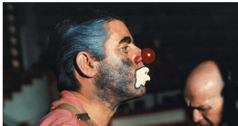
Olaszország. Doork, a depressziós bohóc